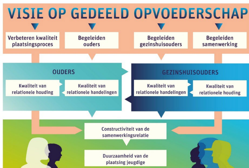
Figuur 1: Werken aan samenwerking tussen ouders en gezinshuisouders